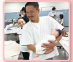
プレママ・プレパパ 赤ちゃんのお世話体験会