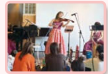
ぴよプラコンサート