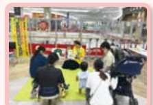
イオンモールナゴヤドーム前 出張ぶらっと講座（企業連携）