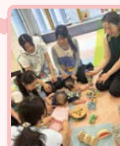
赤ちゃんキャラバン隊 （大学連携）

地域の大学や企業と連携し、子育て講座や親子向けイベントを開催しています。また、子育て支援の出前講座や講師派遣等、「子育てにやさしい企業活動」を促進させるための事業も行っています。