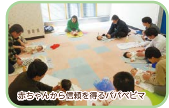
赤ちゃんから信頼を得るパパベビマ

758キッズステーションでは、パパと子どもを対象とした様々な講座を開催しています。ここ数年で育休を取る男性が大幅に増えたこともあり、より低月齢から父子で過ごす機会が増えているように感じます。それに伴って、初めて子育てするパパから「動きの少ない赤ちゃんにどう接したらよいかわからない」という声をたくさん聞くようになりました。そんな初心者パパが自信を持って楽しく、赤ちゃんと接することができるように、父子のふれあい、スキンシップをはかる目的で、ベビーダンスやベビーマッサージの講座をパパ向けに開催しています。パパはママに比べて赤ちゃんとの接する時間が短かったり、子どもが生まれる前に子育てのことを学ぶ機会が少なかったりするため、こういった講座に参加することで父子の時間を楽しくいただけたら嬉しいです。